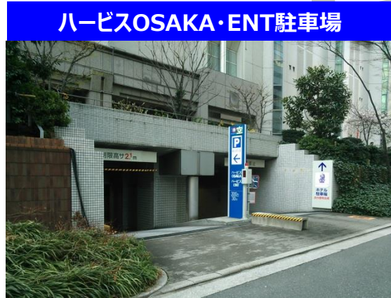
ハービスOSAKA・ENT駐車場

当日最大1800円 クレジット可・約160台可! ハイルーフ可(高さ2.0m迄) 30分毎300円、7~24時営業