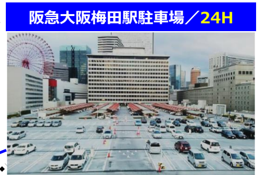
阪急大阪梅田駅駐車場/24H

ホテル阪急 インターショナル直結 約390台可 クレジット・電子 マネー・PiTaPa 決済可 30分毎250円 7~23時営業