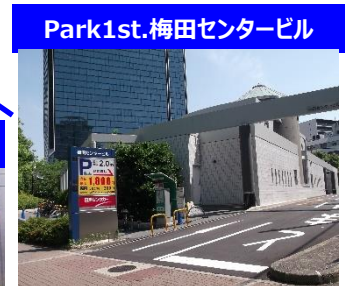
Park1st.梅田センタービル

当日最大1800円 クレジット可・約160台可! ハイルーフ可(高さ2.0m迄) 30分毎300円、7~24時営業