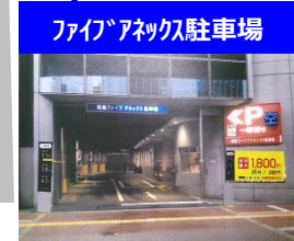
ファイブアネック駐車場

クレジット決済可・約330台可。 最初1時間600円、以降30分毎300円 7~24時営業