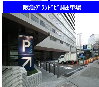
阪急グランドビル駐車場

8-18時:20分毎200円 18-翌2時:30分毎300円 2-8時:1時間毎100円