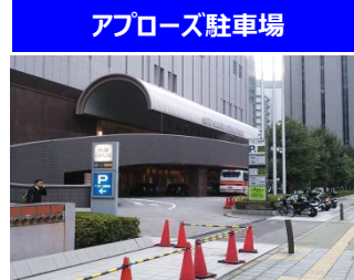
アブローズ駐車場

8-23時:平日30分毎200円 (土日祝:30分毎300円) 夜23-8時:60分毎200円